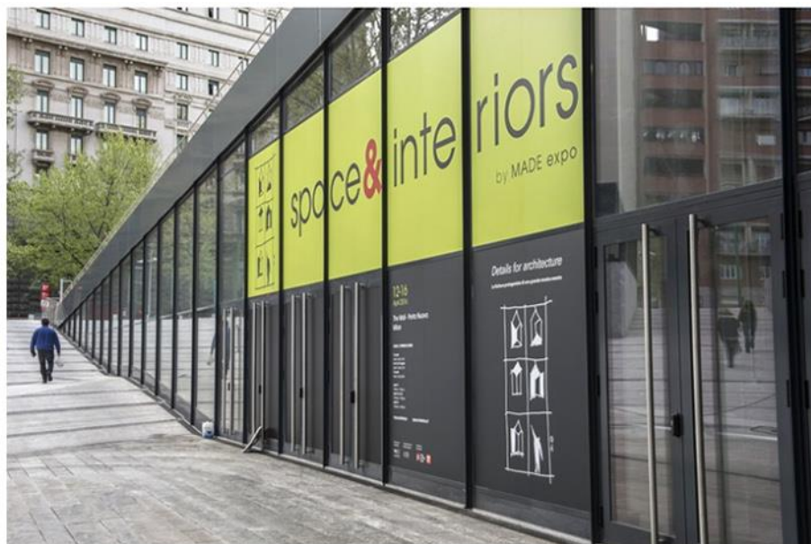
Al via la seconda edizione di space&interiors

Le aziende protagoniste: 2Tec2, Abet Laminati, Alberto Mazzonetto, Arte, Barausse, Bianchi Lecco, Campolongo Italia, Cladia With Ductal Inside, DI.BI. porte blindate, Effebiquattro Milano, Effetalia, Erco, Errebi Marmi, Fewood, Fibra, Franchi Umberto Marmi, G.M.C., Garfagnana Innovazione, Giardini Wallcoverings, Internazionale Marmi e Macchine Carrara, Jansen, Julia Marmi di Laurino Mario e Scaravetto Lucilla, Legnoform, Lu-Bek, Marmi Carrara, Mogs, Officine Mandelli, Oikos Colore e Materia per l'architettura, Oikos Venezia, Okey, Oli, Omexco, Orac Decor, Phonotamburato, Renolit, Sa.Ge.Van. Marmi, Salice Paolo, Tailor Made Contract, Torterolo & Re, Vighi Security Doors , Yo2, Zanette.